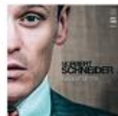
Das aktuelle Album

05. Mai 2018 - 19.30 Uhr HAYDNHALLE GERHAUS