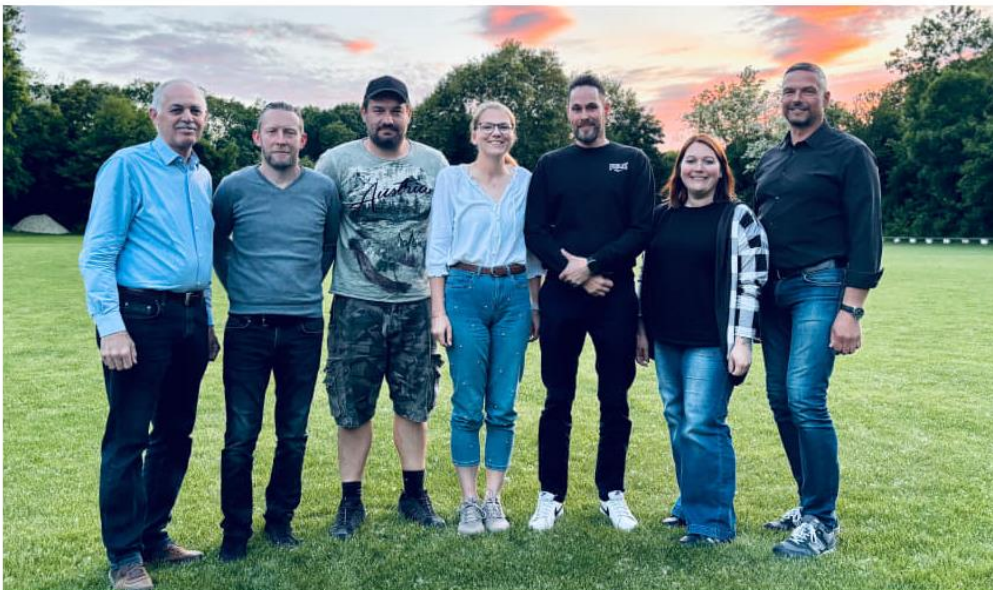
Personen auf dem Bild v.l.n.r.:

Mit dem neuen Vorstand blicken die Verantwortlichen des SC Rohrau-Gerhaus zuversichtlich in die Zukunft. Ein Appell an alle Vereinsmitglieder: Steht dem neuen Vorstand tatkräftig zur Seite, denn nur gemeinsam kann der Verein weitergeführt und in eine erfolgreiche Zukunft geführt werden.